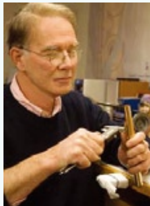
製作者：ダナ・シェリダン

ボストンにて作曲を学ぶかたわら、1972年、ウィリアムズ・S・ヘインズ社で見習としてフルート製作を始める。1977年、パウエルフルート入社。そこでフルートの製作、設計に関するすべてを学び、1981年には運営統括責任者となる。その後ブランネン・ブラザーズ社を経て、1982年に自身のアイデアを実現させるべく、独自の道具づくりを開始し独立。その結果、質の高いサウンドと優れた構造のシェリダン・フルートは高く評価され、世界に認められるブランドとなった。長らくドイツのケルンで製作活動を行って来たが、2017年から拠点をボストンに戻し現在に至っている。